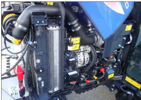
Stage 5 moottori, helppo huoltaa, irroitettavat sivuposket