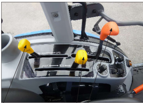
Etu VUO valinta Aluevaihte vipu Taka VUO 540/750