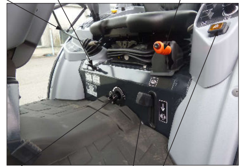
Joystick Joysticklukitus Käsijarru 3-piste laskunopeuden säätö Majakka kytkin Tasauspyörästönlukko