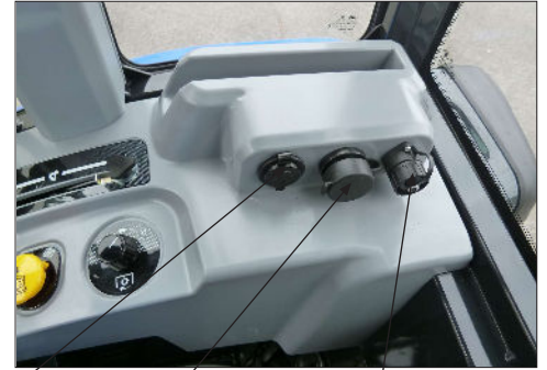
USB-liitin 12V ulosotto Testiportti