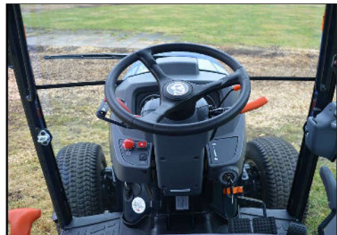
Erinomainen näkyvyys tilavasta ohjaamosta