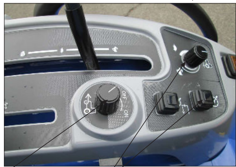
4-vedon kytkin Vakionopeudensäädin muistitoiminnolla Liikkeellelähdon säätö